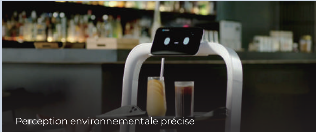
Perception environnementale précise